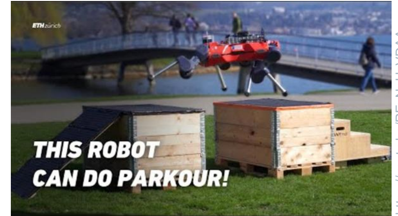
Advanced Legged Locomotion with RL – Click for Video