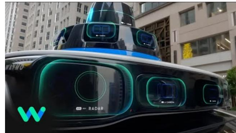
Waymo Self-Driving Cars – Click for Video