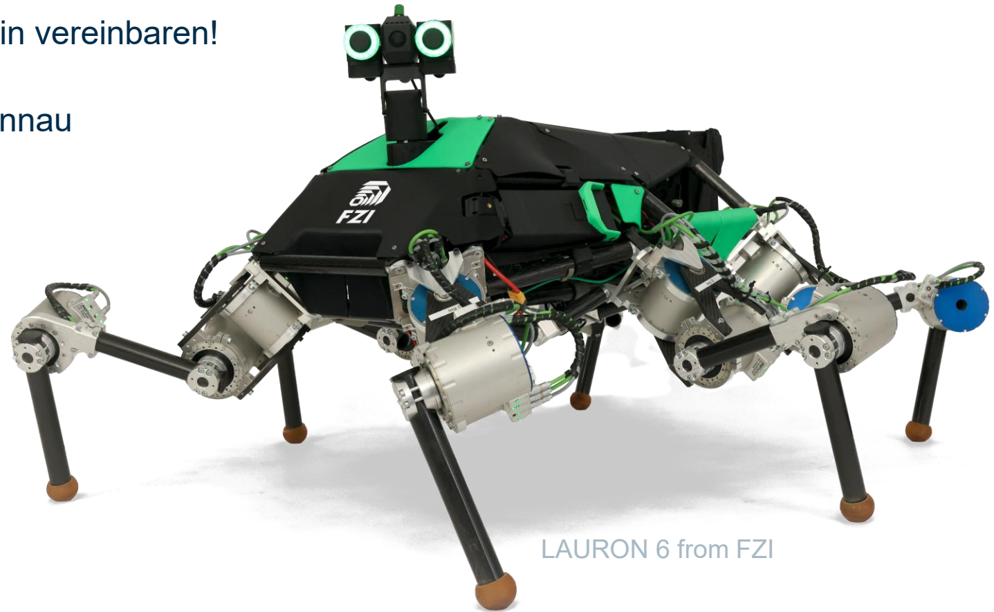
LAURON 6 from FZI