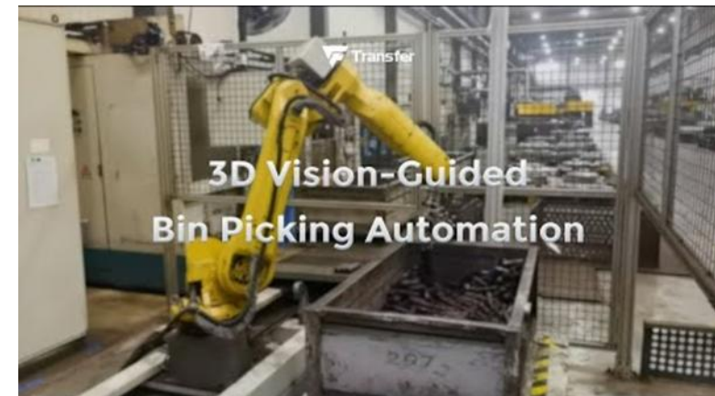
AI-based Bin Picking in Industry – Click for Video