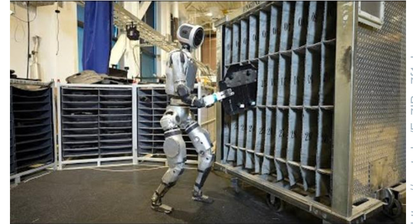
Boston Dynamics Humanoid Robot in Production – Click for Video