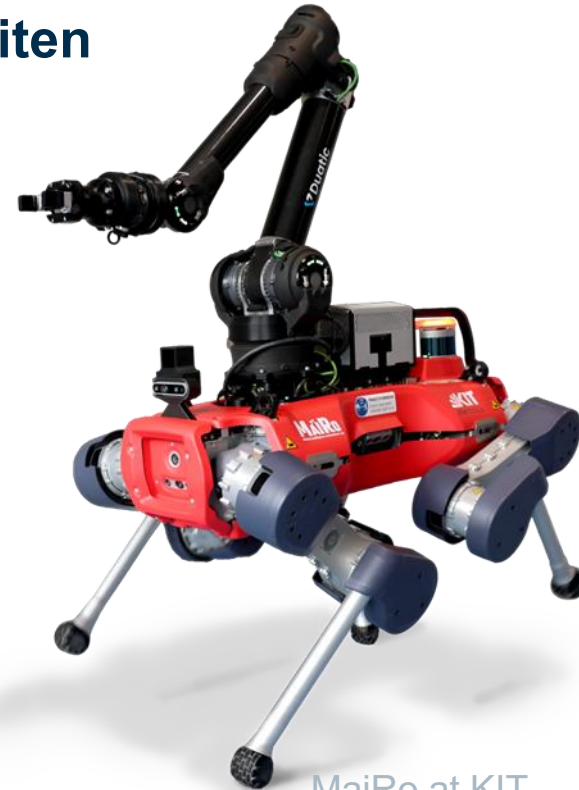
MatiRo at KIT