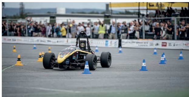
Das autonome Fahrzeug KIT19d von KA-Racelng bei der Formula Student 2019 in Hockenheim.

Die Formula Student ist weltweiter Hochschulwettbewerb, in dem Rennwagen konstruiert und gefertigt werden. Es gibt zum einen die sogenannten statischen Disziplinen, bei denen beispielsweise die eigenen Designentscheidungen reflektiert und verteidigt werden müssen, und zum anderen die dynamischen, in denen es dann wirklich auf die Rennstrecke geht. In der Driverless-Klasse fährt der Rennwagen ganz ohne Fahrer, also autonom. Dabei ist die Rennstrecke für die Boliden von gelben und blauen Hütchen begrenzt, anhand derer sich das Fahrzeug in einer relativ gut definierten Umgebung zurechtfinden kann. Das Thema Performance spielt eine sehr große Rolle. Sei es beim Beschleunigungsrennen, der Kreisfahrt (Skid Pad), oder in der Königsdisziplin Autocross: hier ist die Strecke unbekannt, und die Fahrzeuge müssen mithilfe von Sensoren wie LiDAR und Kamera eine eigene Karte erstellen,