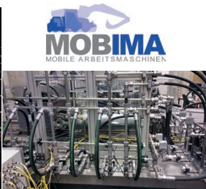
Hydraulikprüfstand des Mobima in der Versuchshalle am Campus Ost