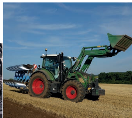
Traktor mit Pflug zur Erforschung lernfähiger Steuerungssysteme in der Landtechnik

Am 1. April 2005, hat der Stiftungslehrstuhl für Mobile Arbeitsmaschinen (Mobima) seine Forschungsaktivitäten an der damaligen Universität Karlsruhe (TH), dem heutigen KIT, begonnen. Die ersten Aufgaben waren der Aufbau von Vorlesungen und die Einrichtung einer Infrastruktur für Forschungsaktivitäten. Bei beidem wurde der Stiftungslehrstuhl von seinen Industriepartnern unterstützt. Die Vorlesung „Mobile Arbeitsmaschinen“ wurde mit Hilfe der Stifter neu aufgebaut und wird bis heute in großen Teilen von ihnen gehalten. Sie wird in den Lehrevaluationen des KIT seit Beginn von Studierenden sehr gut bewertet, was durchaus auch auf die intensive Beteiligung von Industriepartnern und des damit verbundenen Praxisbezugs zurückzuführen ist.