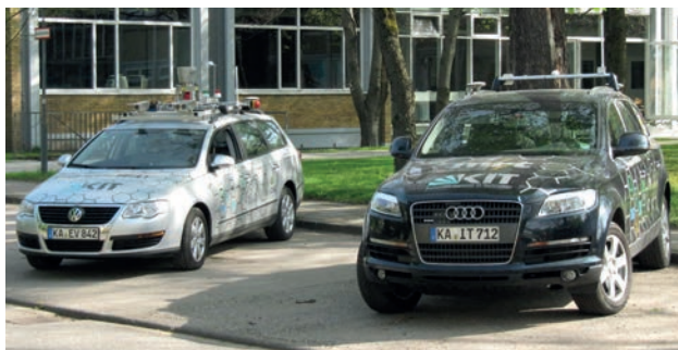
Mit den Versuchsfahrzeugen des KIT wurde bereits mehrfach autonomes Fahren demonstriert. Regelmäßig sind sie in der Karlsruher Oststadt bei Versuchsfahrten anzutreffen.

Seit der Erfindung des ersten Automobils hat sich die Fahrzeugindustrie rasant entwickelt. Zur Unterstützung des Fahrers sowie zur Verbesserung der Verkehrssicherheit wurden in den letzten 50 Jahren eine Vielzahl verschiedener Fahrerassistenzsysteme entwickelt, von denen viele mittlerweile fester Bestandteil von Serienfahrzeugen sind, z.B. ABS, ESP, Spurhalte-, Park- und Notbremsassistenten. Durch diese Systeme konnte die Anzahl der Unfälle im Straßenverkehr deutlich reduziert werden. Die Entwicklung autonom fahrender Automobile ist der nächste logische Schritt, um die Unfallzahlen weiter zu reduzieren und den Fahr-