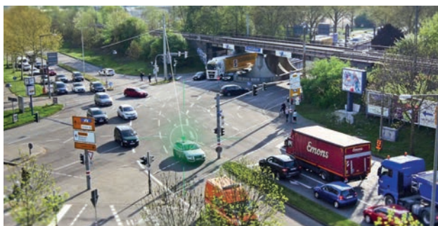
Mit Sensoren und Kommunikationseinrichtungen ausgestattete Forschungskreuzung (Durlacher Allee - Ostring) in Karlsruhe; Foto: TAF-BW

Die Machbarkeit des hochautomatisierten Fahrens wurde im Rahmen diverser Demonstrationsprojekte bzw. Show-Cases für einzelne Verkehrssituationen bereits aufgezeigt. Jedoch stellen sich durch die für eine Markteinführung notwendige Generalisierbarkeit völlig neue Herausforderungen an das autonome Fahrzeug. Zur Serienreife ist es jedoch noch ein weiter Weg. Durch die Möglichkeit Fahrzeuge ohne Fahrer fortzubewegen ergeben sich sowohl neue Mobilitätsformen und damit neue wirtschaftliche Möglichkeiten aber auch potenziell neue Gefahren. Die Herausforderung