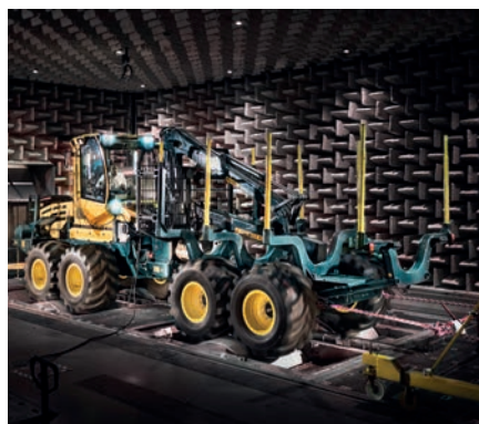
Forwarder (Tragrückenschlepper zum Einsatz in der Holzernte) auf dem Allrad-Akustik-Rollenprüfstand